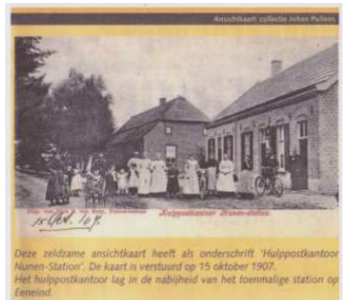
Afb. 1: Hulppostkantoor te Nuenen-