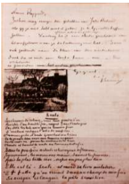
Een brief aan Amice Rappard

Van de brieven die we van Vincent kennen - 819 in totaal - schreef hij er onder andere 651 aan zijn broer Theo, 57 aan zijn toenmalige vriend Anton van Rappard en 21 aan zijn zus Wil. In deze laatstgenoemde brieven adviseerde Vincent zijn zus vooral “niet in de kunst te gaan”. Het is duidelijk dat hij zijn eigen teleurstellingen soms projecteert in deze brieven.