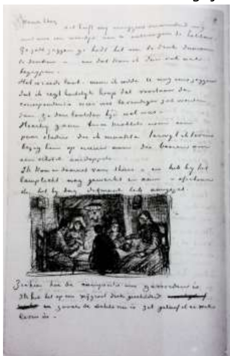
Een van de schetsen van de aardappeleters

Heel boeiend is om te zien hoe in de loop van jaren het uiterlijk van Vincents epistels verandert. Zoals in de eerste twee foto's bij dit artikel te zien is, verandert de schrijfstijl (de ductus) in de tijd, maar is deze soms ook afhankelijk van zijn gemoedstoestand. Ook in een en dezelfde brief verandert vaker de ductus: wellicht onder invloed van het slechte licht en de genuttigde alcohol? De inhoud van de brieven is bijzonder ("literair"), maar de schetsen maken de brieven nog kunstzinniger. Dit opnemen van schetsen is wel gangbaar in bepaalde kringen in die tijd. Paul Gauguin maakt er ook vaak gebruik van. Vincent gebruikt deze tekeningen niet om een ander te vermaken, daar was hij te serieus voor, maar wel om de essentie van een tekening of schilderij weer te geven. Omdat Vincent steeds bekwamer en sneller werd in het schetsen, vormen deze schetsen dan ook een steeds belangrijker onderdeel van zijn brieven.