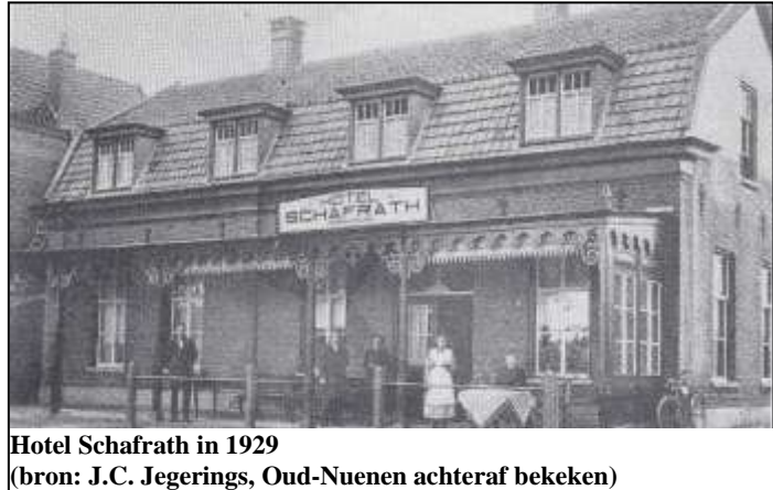
Hotel Schafrath in 1929